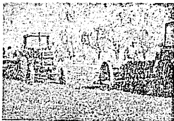
Fotoreporterul nostru Marcel Cancliu a surprins pe peliculă aspecte de la două lucrări specifice actualei campanii: culesul porumbului la C.A.P. Șagu (fotografia din stînga) și semănatul grîului la C.A.P. Vinga (fotografia din dreapta).