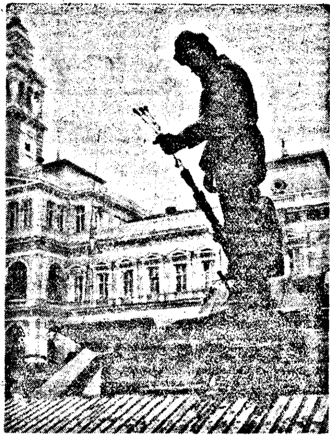
Flori pentru soldații noștri.