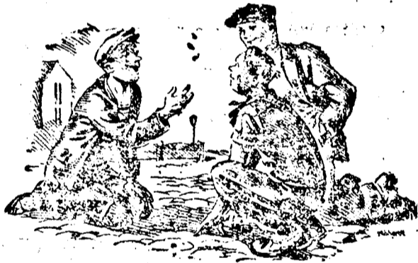
Az első parti: fej-e, vagy írás...