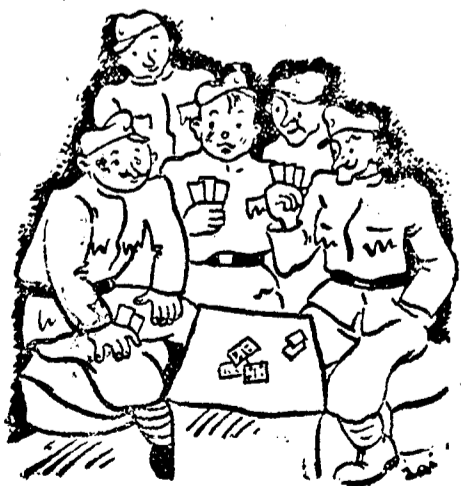
Katonák a lövészárokban.

— A háboru után jutottunk el aztán ahhoz a játéklázhoz, amelynek pszichológiai alapja megfelel annak a nagy táncórületnek, amely közvetlenül a békekötés után dühöngött. Amde a játékszenvedély legyőzte a táncórületet. A gazdasági krízis súlyos idejét éljük. Az emberek a maguk foglalko-