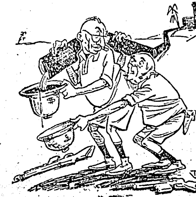
Intre agresorii din Orientul arab: Numai colaborarea ne poate salva interesele... (desen de N. TIMOC)

DJAKARTA. Trupele guvernamentale indonezience continuă să lichideze trupele rebelle. Pină în prezent, numai în Sumatra de vest peste 2.000 de rebeli printre care cîțiva ofițeri superiori s-au predat trupelor guvernamentale. Totodată a fost capturată o mare cantitate de armament.