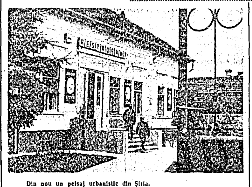
Din nou un peisaj urbanistic din Șiria.