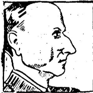
Sir Samuel Hoare

Expunerea lui Sir Samuel Hoare în Camera Comunelor