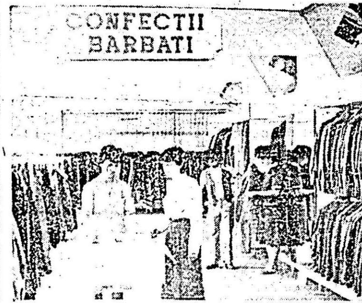
Magazinul de confecții din piața UTA, bine aprovizionat cu sortimente de sezon, se remarcă printr-o servire de calitate.