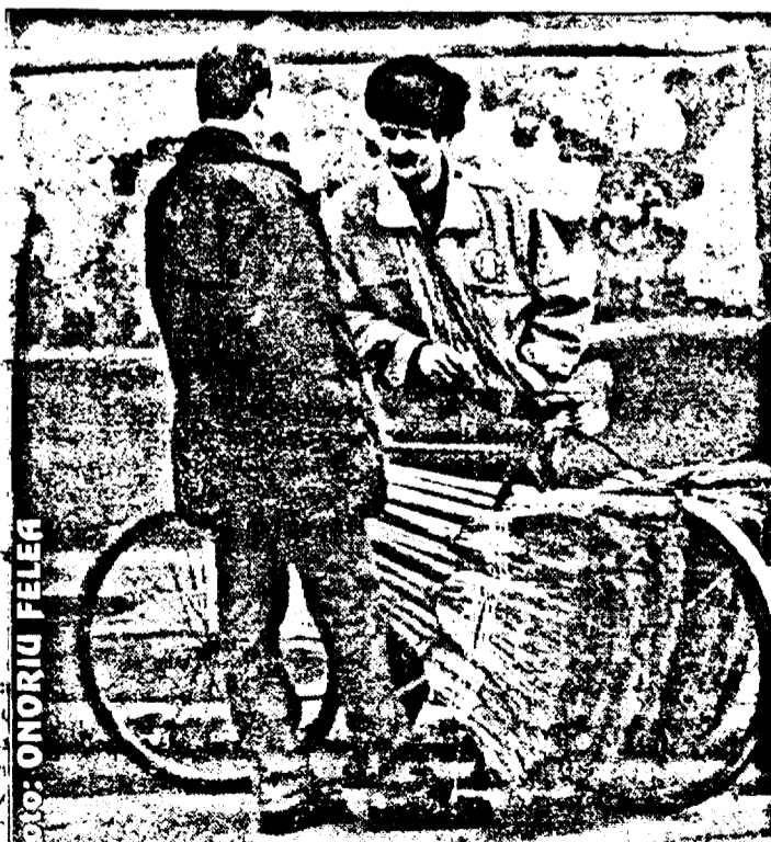
Pentru quinoi rămâne... mătura!

Din cauza reducerii cantităților de gaze importate