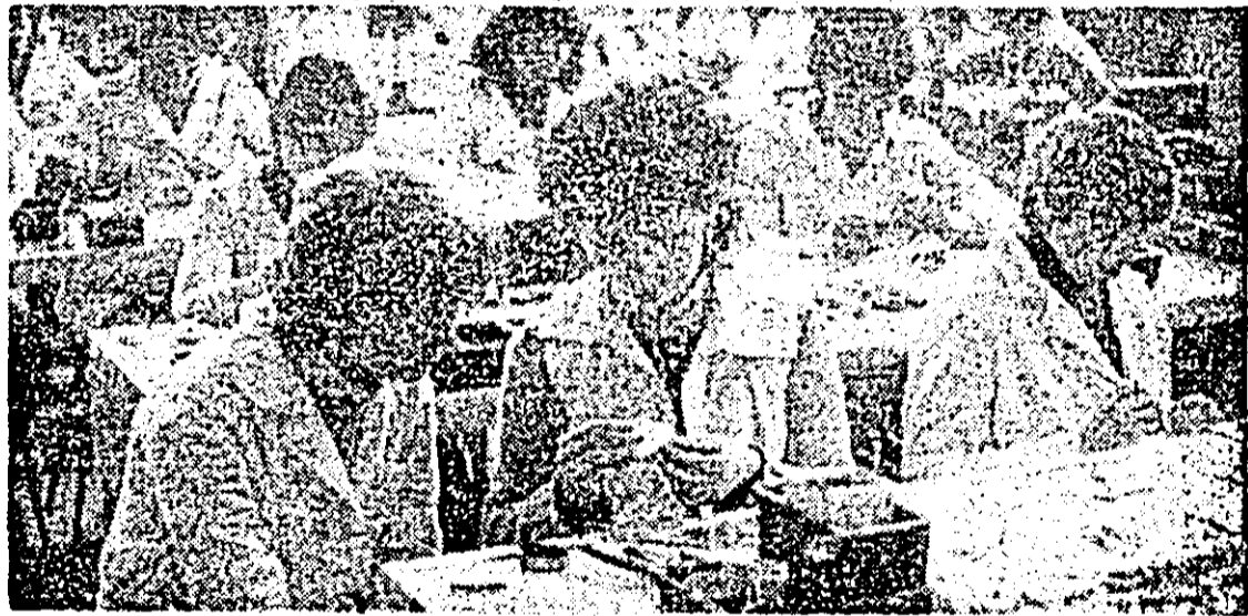
Aspect de muncă în atelierul montaj final al întreprinderii de orologerie.