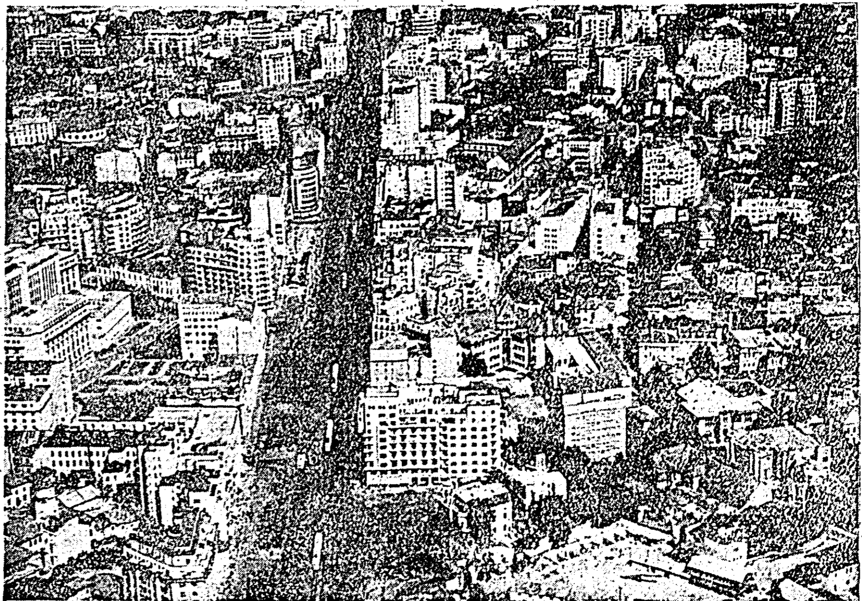
Bucureștiul de astăzi, văzut din heliocopter — bulevardele Băicoșcu și Magheru.