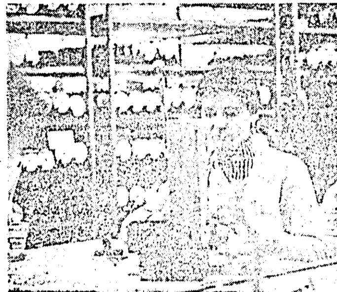
Întreprinderea de ceasornice „Victoria”. Aspect de muncă la linia de montaj.