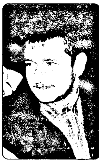
- Contractul meu expiră în vara anului 1997. Clubul dorește să rămân la Craiova, dar eu aș vrea să joc la o echipă din străinătate. Dacă

- Te gândești să rămâi în Bănie după încheierea contractului?