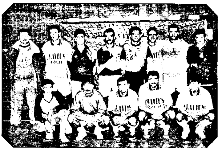
Selecționata „stranierilor“, câștigătoarea Turneului de Anul Nou la minifotbal.