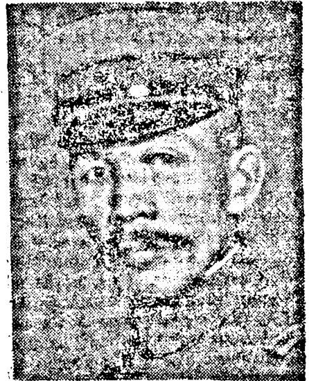
ARAKI japán hadiügyminiszter, aki háborút követel a Szovjet ellen

Moszkvából jelentik: A japán bombavetőrepülőgépek határsértése ügyében egyre jobban kiéleződik a helyzet Japán és Szovjet-orszország között. A Szovjet utasította tokiói nagykövétét, hogy újabb jegyzéket nyújt-