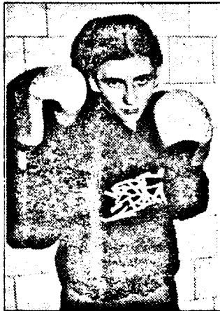
acordă la început, dar în timp s-au obișnuit cu ideea.