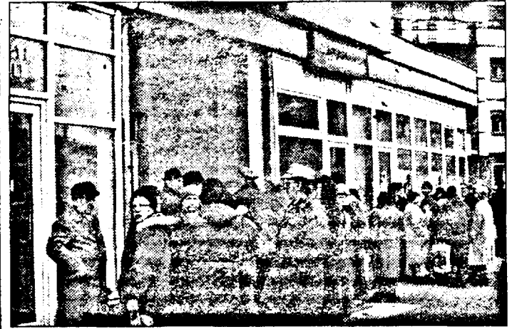
Cozi, de dimineața până-n seară la casierile RCS-Intersat pentru plata abonamentului la cablu TV

Legat de cozile de la casierile noastre, vă pot spune că,