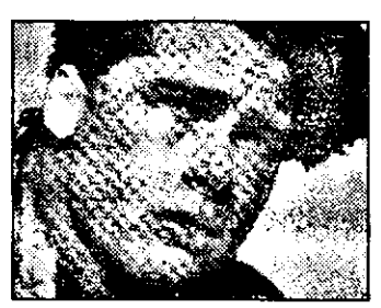
PRO7 - 21,00 Lapidare în Fulham County - f. av. SUA cu Brad Pitt

7,10 Good Grief - s. 7,40 Ciao, ciao mattina - d. a. 10,15 Supervicky - s. 10,45 Părinți în blugi - s. 11,20 McGyver - s. 12,30 T. J. Hooker - s. 13,25 Studio deschis 13,45 Fapte bune, fapte rele - magazin 13,50 Studio Sport 14,00 Lady Oscar - d. a. 14,35 Lupin, incorigibilul Lupin - d. a. 14,55 Inspectorul Gadget - d. a. 15,30 Lovitură fulgerătoare - show 16,05 Generația X - show