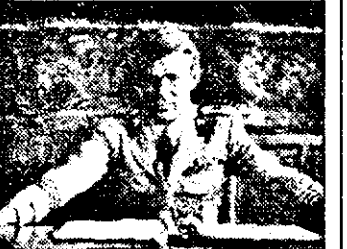
SAT1 - 1,00 Jocul puterii - thriller Canada cu Peter O'Toole

6,30 Magazin matinal 10,00 L.A. Law - s. pol. SUA: Mașina ta ești tu 11,00 Ai cuvinte? - conc. tv 11,30 Poker - conc. tv 12,00 Johannes Kerner - talkshow 13,00 Vera - talkshow 14,00 Trapper John MD - s. am.: Răs bolnăvicios 15,00 Hart to Hart - s. pol. SUA: Tapet scump 16,00 Star Trek - s. sf. am. 17,00 Baywatch - s. av. SUA cu David Hasselhoff 18,00 XXO - Fritz & Co - conc. tv 18,30 Emisiuni regionale 19,00 Totul sau nimic - conc. TV 19,30 Știri, sport, meteo 20,00 Roata norocului 21,00 Lovitură de grație - f. av. Germ. 1995 23,00 Spiegel TV - reportaje 0,30 Harald Schmidt talkshow 1,00 Jocul puterii - f. pol. Canada cu Peter O'Toole, Donald Pleasance 2,50 Star Trek - s. rel.