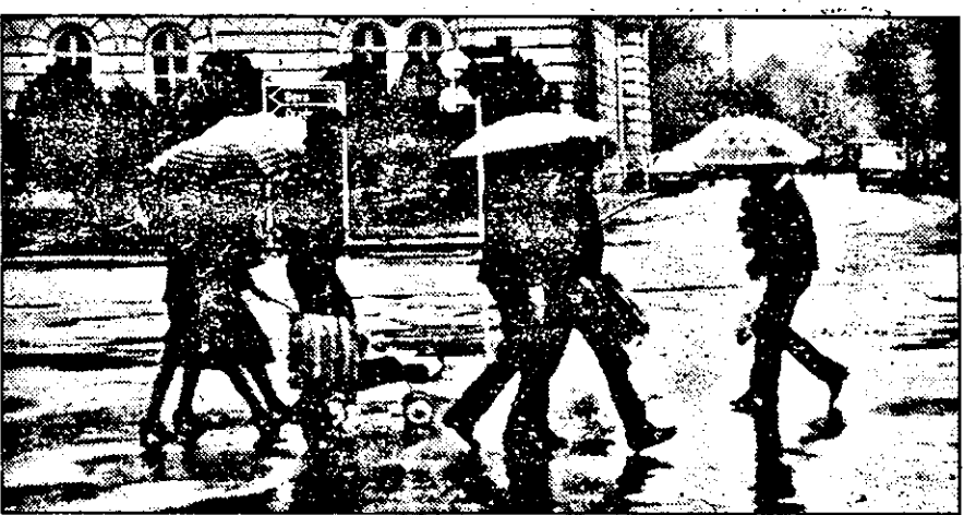
În martie, ca-n noiembrie...