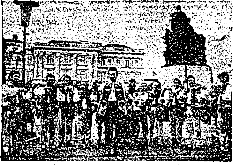
Ansamblul folcloric „Rapsodia mureșană” al clubului Întreprinderii de vagoane.

tractive ce duc la antrenarea unui număr sporit de muncitori. Activitatea artistică se evidențiază în mod deosebit și prin ansamblul folcloric „Rapsodia mureșană” de pe lângă sindicatul Întreprinderii, prezent la toate întrecerile și festivalurile folclorice de anvergură, atât județene cit și republicane. Distincțiile și meda-