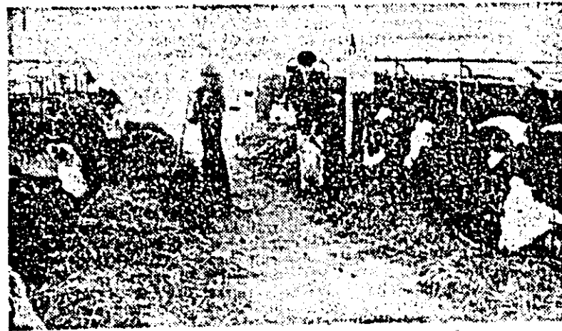
I.A.S. Nădlac: aspect din secția rului zoolohic.

Fapte. Multe la număr, în marea lor majoritate semnificative pentru modul cum se achită de îndatoriri constructorii de vagoane din această secție a întreprinderii. În această ambianță de efort creator, de conștiință înaltă, cum spuneam, apar însă și disonanțe. Nu multe, e drept, dar nu de neglijat.