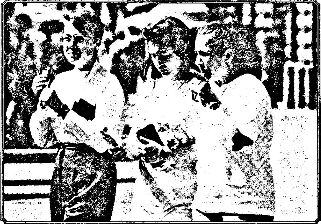
Fără griji. A venit vacanța mare.