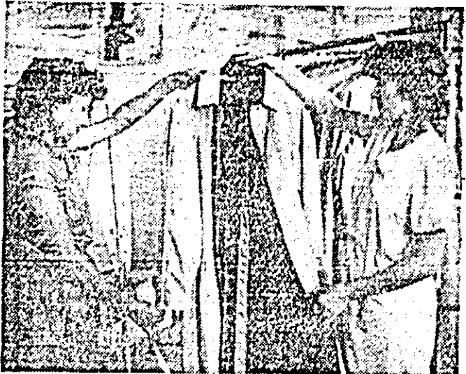
Cu grijă deosebită pentru calitate: controlul final al produselor la întreprinderea de confecții.

scriind în cronica întrecerilor socialiste noi și însemnate succese. Puternic mobilizat de indicațiile și orientările formulate de secretarul general al partidului, tovarășul Nicolae Ceaușescu, colectivul oamenilor muncii din cadrul Centralei electrice de termoficare raportează îndeplinirea planului producției de energie electrică pe primele opt luni din acest an cu 20 de zile în devans, urmînd ca pînă la sfîrșitul perioadei să livreze economiei naționale 5650 mil kWh, iar planul pe primul trei ani și opt luni din actualul cincinal a fost îndeplinit în trei ani și cincinți, livrîndu-se economiei naționale peste 25800 mil kWh în condițiile în care se înregistrează realizarea sarcinilor de plan, trează importante economii la consumurile specifice.