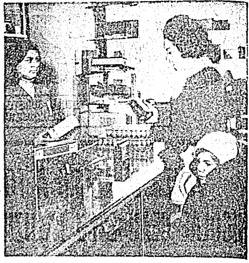
Bine aprovizionat, magazinul nr 98 „Romanja” al OCL „Produs industriale” e solicitat de numeroși cumpărători.