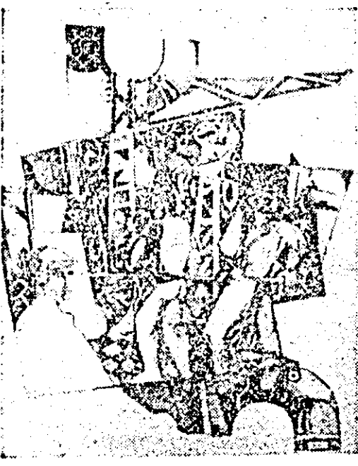
KET GROZA „Otelari”