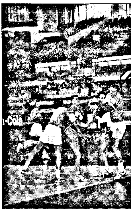
În primul meci al Memorialului Dan Bobeică, arădenii de la Arbema au câștigat (scor 30-27) partida cu timișorenii de la Poli.

Superliga poloului românesc ne oferă, astăzi și mâine, la Bazinul acoperit, două partide atractive dintre