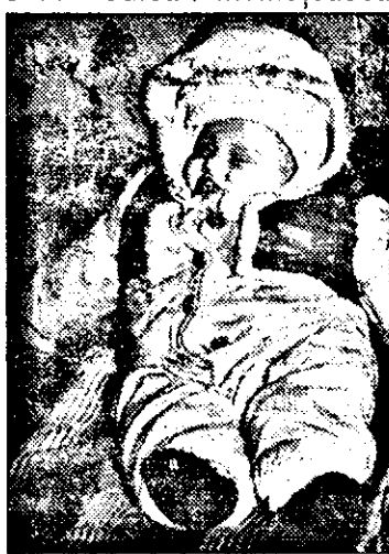
La patru luni, mai aproape de moarte decât de viață...

În numai jumătate de oră, lucrurile se precipită. Copilul a început să se