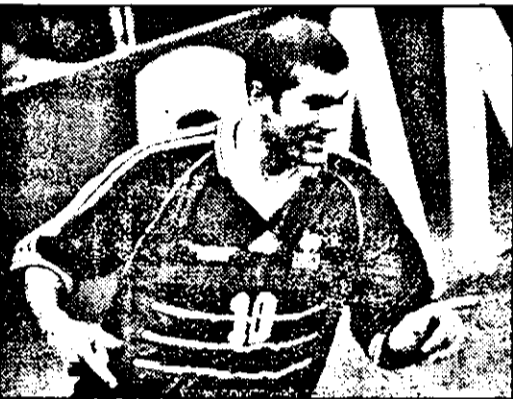
Zidane, eroul finalei, și bucuria unei noi reușite.