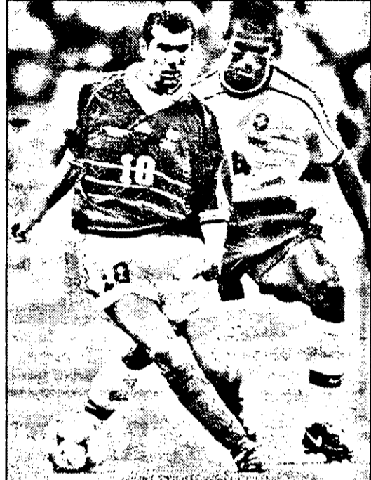
Franța - campioană mondială