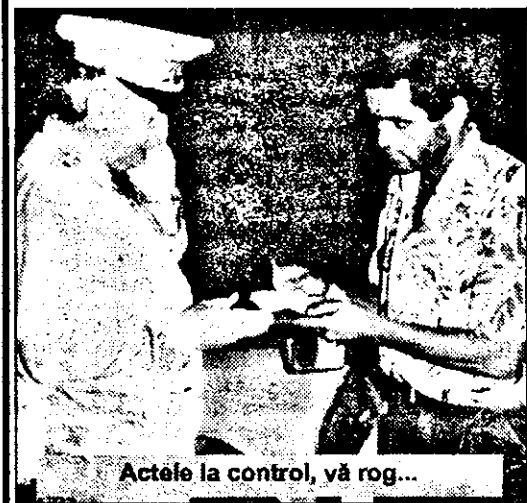
Actele la control, vă rog...

După ce facem cunoștință cu polițiștii, stabilim în mare ca-m cum o să acționăm. Am lăsat neprevăzutului ce-i a lui, fapt confirmat,