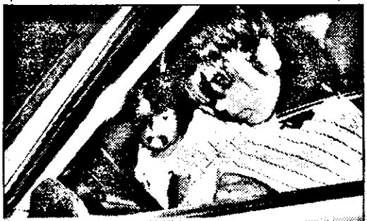
Cu al mic pe scaunul din dreapta, mama nu conduce prea liniștită.

tate, trebuie s-o spunem, circula regulamentară și aveau asupra lor toate documentele mașinii