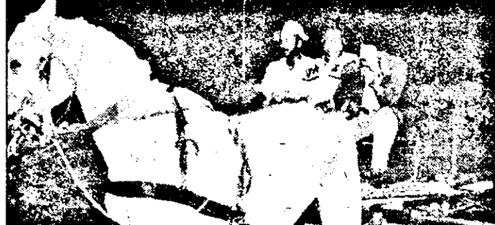
Căruțele neiluminate - pericol permanent pe drumurile publice.