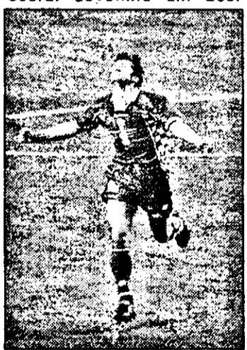
Davor Suker și bucuria celui de-al șaselea gol al său la acest turneu final...