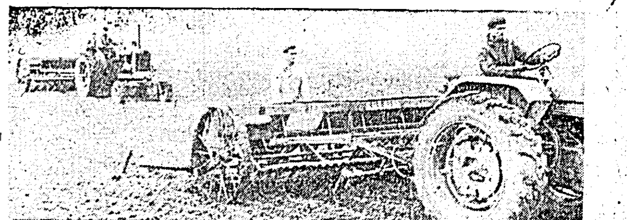
ÎN CLIȘEU: Cooperatorii din Aradul Nou lucrind la semănatul grului.

32 pag. 0,75 lei Broșura a fost tipărită într-un tiraj de masă.