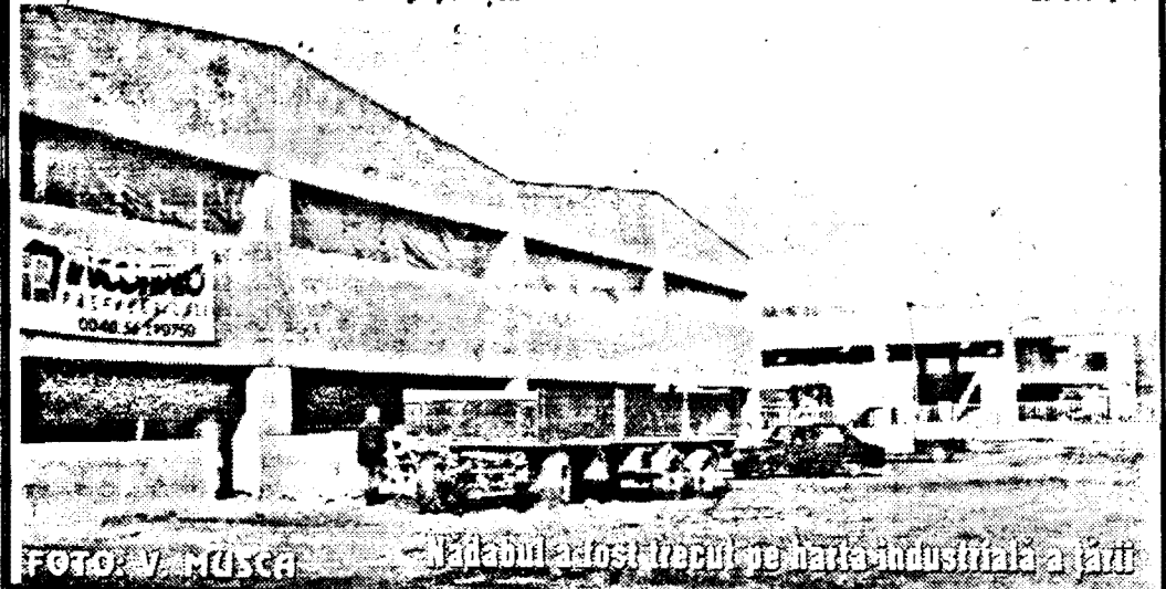
KAPALUL A FOST TRĂCIUL PE HALA INDUSTRIALĂ A ȚĂRI