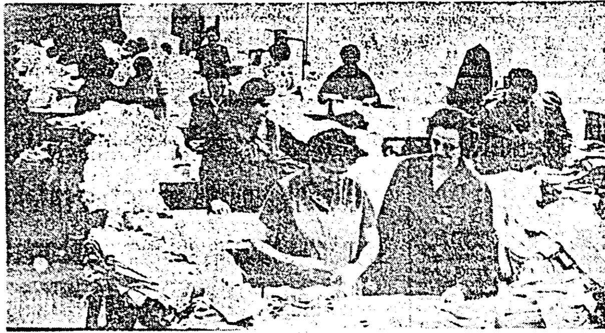
La „Tricolor roșu” controlul tehnic de calitate își face din plin datoria.