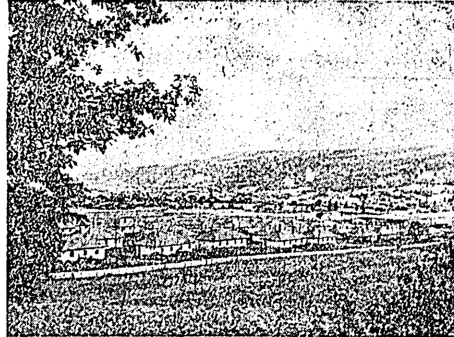
Locuințe noi construite pentru muncitorii rafinării nr. 8 de la Dărmănești.