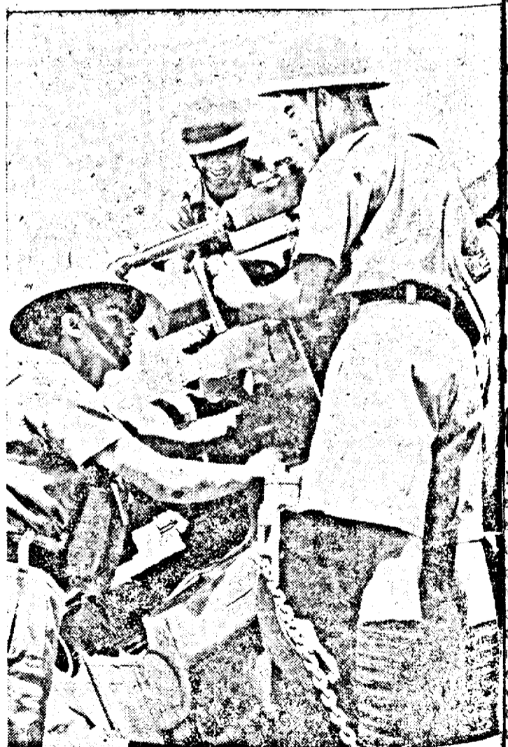
Instalații speciale pe coasta Angliei pentru prevenirea inamicului.