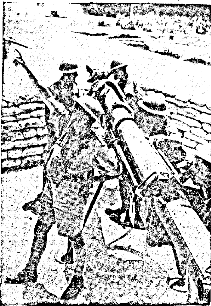
O baterie antiaeriană engleză.