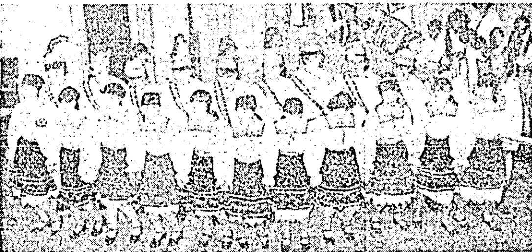
Formația de dansuri populare a căminului cultural din Pecica.