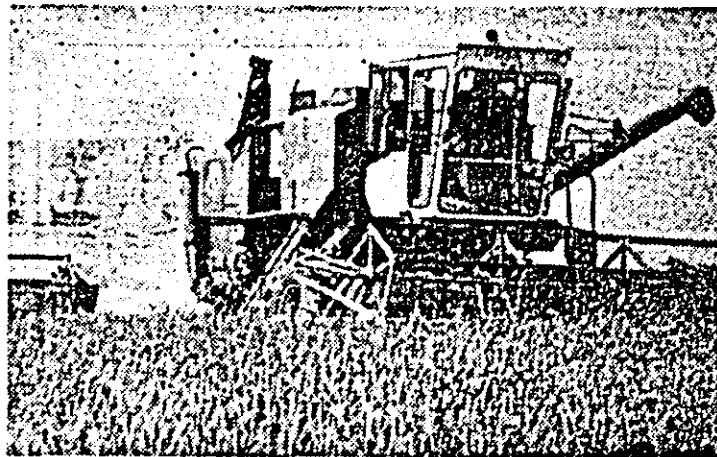
La CAP Frumușeni se acționează intens pentru încheierea cit mai grabnică a secerii și punerea recoltei la adăpost.