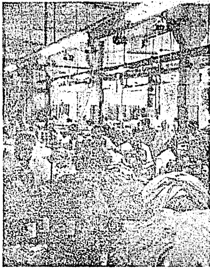
Aspect de muncă de la secția din Ineu a Intreprinderii „Tricolul roșu”.