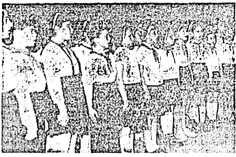
Se prezintă în clasa de mai sus corul Școlii generale nr. 4 care la faza de cartier a concursului „Cu cîntecul și dansul pe plaiuri bănățene” a lăsat o frumoasă impresie. Acest cor a fost clasificat pentru faza orașenească a concursului.