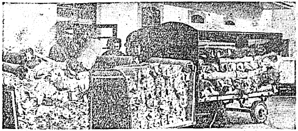
Din secția ambalaj a uzinelor „30 Decembrie” un nou lot de țesături pornește spre magazia centrală. Cîrînd noile produse vor porni spre beneficiarii.