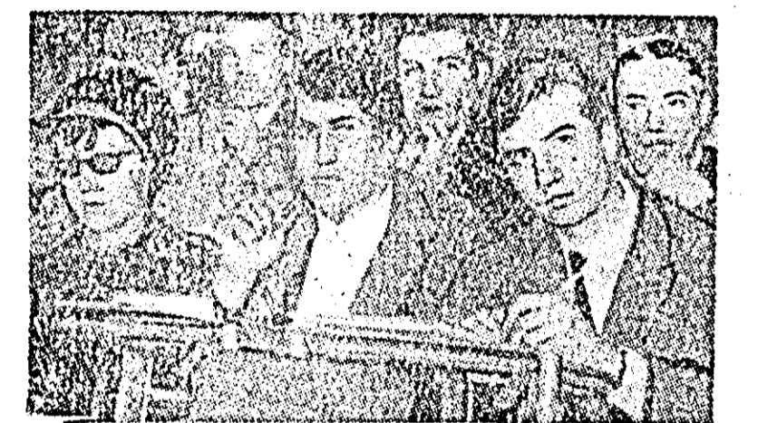
In apărarea revendicărilor profesionale ale tinerilor metalurgiști, C.G.T. din Franța a organizat recent o conferință națională, care e urmată de acțiuni revendicative.

Ian Smith din Rhodesia în decurs de o săptămîna. Ziarul considera că acest mesaj ar fi de natură să provoace o „nouă criză în relațiile Marii Britanii cu Zambia”. Mesajul amintit ar avertiza că, dacă guvernul englez nu dă curs cererii Zambiei, această țară va adopta măsuri pe cont propriu împotriva regimului de la Salisbury. Una dintre acestea ar putea fi, potrivit aceluiași ziar, oprirea oricărei schimb de mărfuri între Zambia și Rhodesia, măsură care nu a fost luată pînă în prezent la insistențele Angliei.