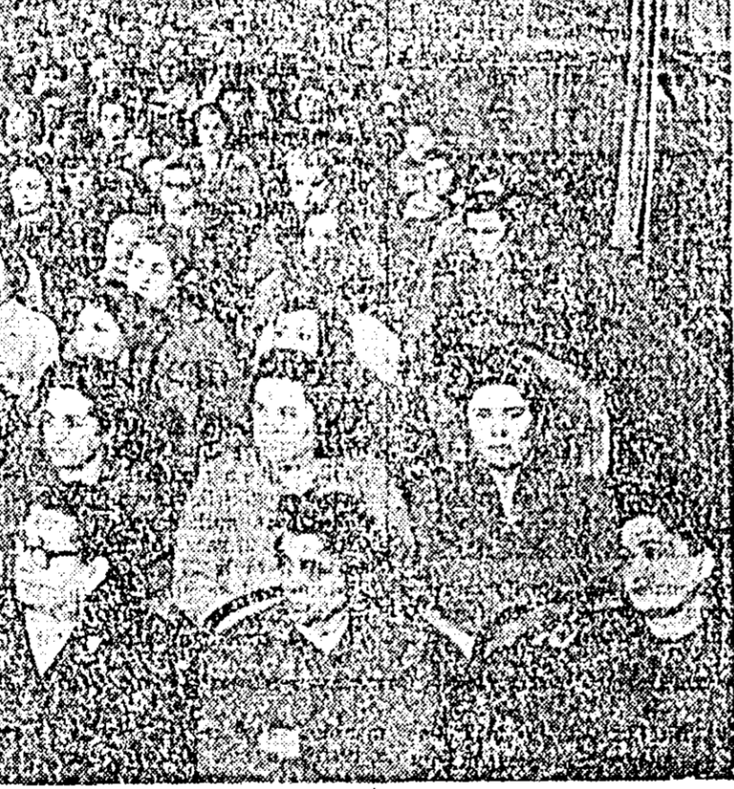
IN CLIȘEU: Un aspect din sală în timpul lucrărilor Conferinței orașenești a femeilor.

treprinderile orașului, din cooperativele agricole de producție, din instituțiile de cultură și artă, din cartiere răspund la toate chemările pe care partidul le adresează lor, prin intermediul organizației de femei. Înfrățind minunatele perspective pe care le deschide noul plan cincinal în desăvîșirea pe mai departe a construcției socialiste din patria noastră, vorbitorul a arătat că datorită hărniciei din noi este de a ne pune întreaga pricepere, hărnicie și abnegație în realizarea unei munci constituționale, oricare ar fi domeniul de activitate în care ne desfășurăm munca zilnică.