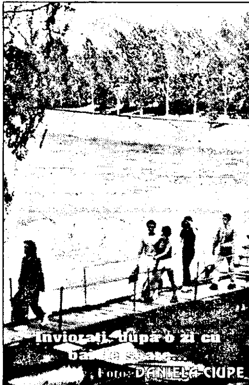
Invizibili după o zi cu

Cei doi au fost dați în urmărire generală. În caz că cineva observă persoane suspecte cu semnalmentele de mai sus este rugat să anunțe Poliția Arad la tel.222995.