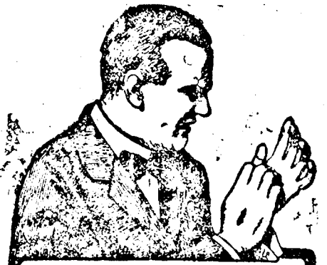
Soba ne vakarja bőrét, a CADUM-KENŐCS rögtön enyhítést hoz

(Chisinau, október 15.) Tegnapelőtt délután szenzációs oskori leletre bukkantak Chisinauban. — Egy eldugult földalatti csatorna tisztítási munkálatai közben végzett ásások alkalmával a munkások kilenc méter mélységben hatalmas méretű állati csontmaradványokat találtak. Az érdekes leletről a város polgármestere táviratilag értesítette a bucaresti-i nemzeti muzeumot, ahonnan ma Floru egyetemi tanár utazott le Chisinauba. A professzor a csontok megvizsgálása után azt a szenzációs feltevést tette, hogy