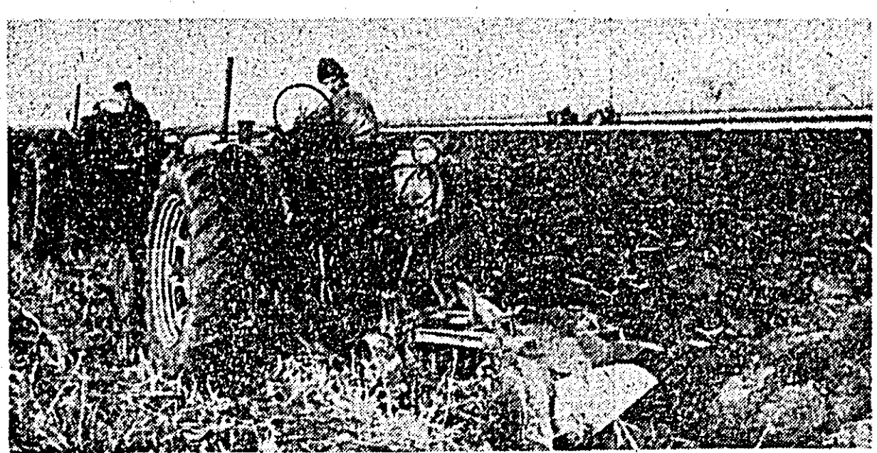
Brigada nr. 29 de la SMT Aradul Nou lucrează din plin în aceste zile la efectuarea arăturilor de toamnă la cooperativa agricolă de producție din Bujac.

Mecanizatorii din raionul nostru au intensificat ritmul de lucru la executarea arăturilor adînci de toamnă. Ca urmare s-au obținut rezultate bune la cooperativelor agricole „Ogorul” din Pecica și Fîșcut unde arăturile s-au efectuat pe întreaga suprafață. Avansatul pe aceste lucrări sînt și mecanizatorii care muncesc pe ogoarele cooperativei de la Șag, Crucești, Frumusești, Hunedoara Timișană, Sederhat și altele.