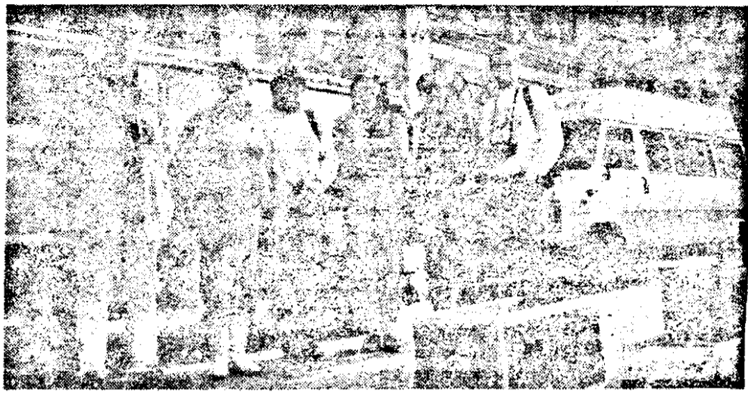
Un nou ajutor umanitar din partea Societății „Diaconia” din Suedia pe adresa han dicapitelor neuromotor din România. în fața Prefecturii județului Arad.