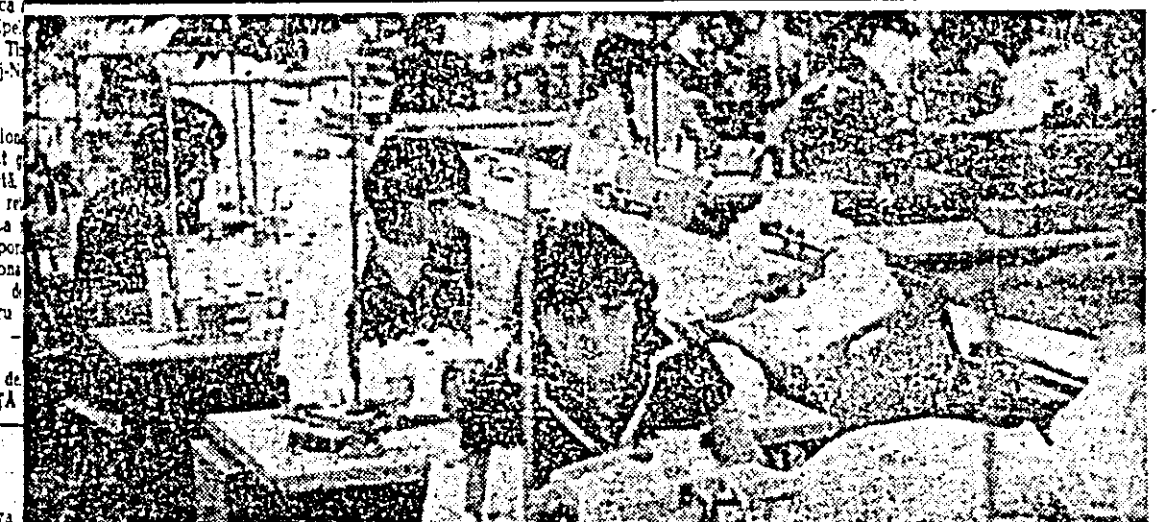
Aspect de muncă de la Întreprinderea „Tricolor roșu” — secția confecții, agregatul nr. 1, frunțay în întrecerea socialistă.

față de cea cu care ne-am obișnuit. So vinde la borcan de 400 grame și costă 11,40 lei. — Și în al doilea rînd? — Smîntîina dulce pentru cafea, asemănătoare din punctul de vedere al consistenței cu frișca. Se livrează în sticle de 250 ml, la preț de 2,70 lei. Se folosește în cafeaua naturală (2—3 lingurițe, după preferință). Trebuie să reținem faptul că acest produs, bogat în proteine, este recomandat celor suferinzi care nu au voie să consume cafea cu cofeină. De asemenea, în comparație cu frișca obișnuită, noul sortiment are un conținut de grăsime mai scăzut (doar 14 la sută). — Acestea fiind noutățile deja concretizate, ce ne va mai oferi, în perspectiva apropiată, Întreprinderea de Industrializare a laptelui? — În cadrul preocupărilor noastre pentru diversificarea gamei de produse, sînt în fază de finalizare, printre altele, noi sortimente de lăut, pe care, nu peste multă vreme, consumatorii le vor putea întâlni în unitățile de desfacere. R. POPESCU, T. MIHUȚA