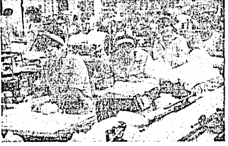
Aspect de muncă în secția confecției a întreprinderii „Tricoul roșu” Arad.

În cadrul întrevederii au fost abordate probleme privind dezvoltarea relațiilor romano-americane, precum și unele aspecte ale vieții internaționale actuale.