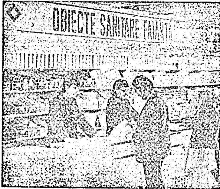
Recent, I.C.S.M. metalo-chimico Arad a deschis pe Calea Armatei Roșii un nou și modern magazin „Tehnico-sanitare” care pune la dispoziția populației un bogat sortiment de articole de specialitate.

● Din cele mai reușite acțiuni de propagandă conștientă dezbateri de la I.M.U.A. privind cunoașterea și respectarea legilor țării — condiție esențială în păstrarea ordinii și disciplinei în producție și expunerea prezentată în fața numeroși uteciști de la C.P.L. privind împlinirile și perspectivele de dezvoltare economico-socială a județului Arad.