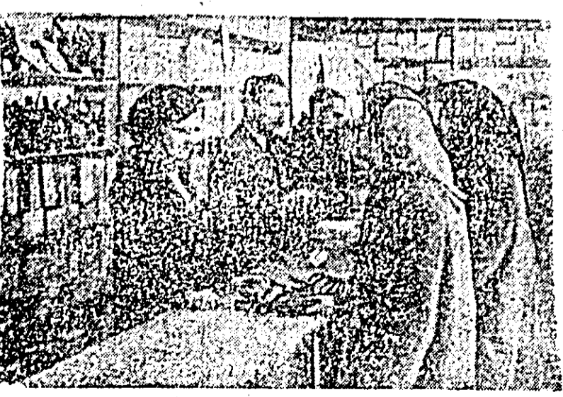
Încă de dimineață magazinele din orașul nostru erau pline de cumpărători care se arătau foarte mulțumiți că din salariul lor pot cumpăra acum mai multe mărfuri.

În fața vitrinei, un om între două vîrstă, fără să spună nimîndui nimic, își făcea loc printre ceilalți, pare-se să vadă mai bine noile pre-