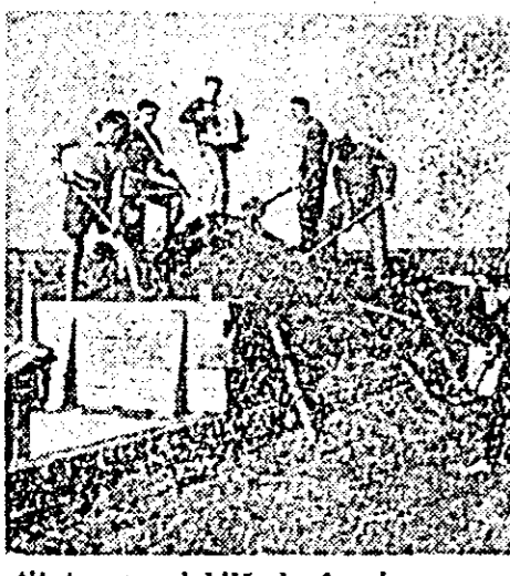
titate apreciabilă de furaje.