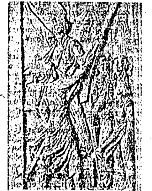
O lucrare a sculptorului Vitroel Emil: Baso-relief, reprezentînd actul măreț al naționalizării.

Expoziția Internațională de la Moscova a țării de democrație populară este cu siguranță cea mai importantă eveniment în domeniul artei plastice.