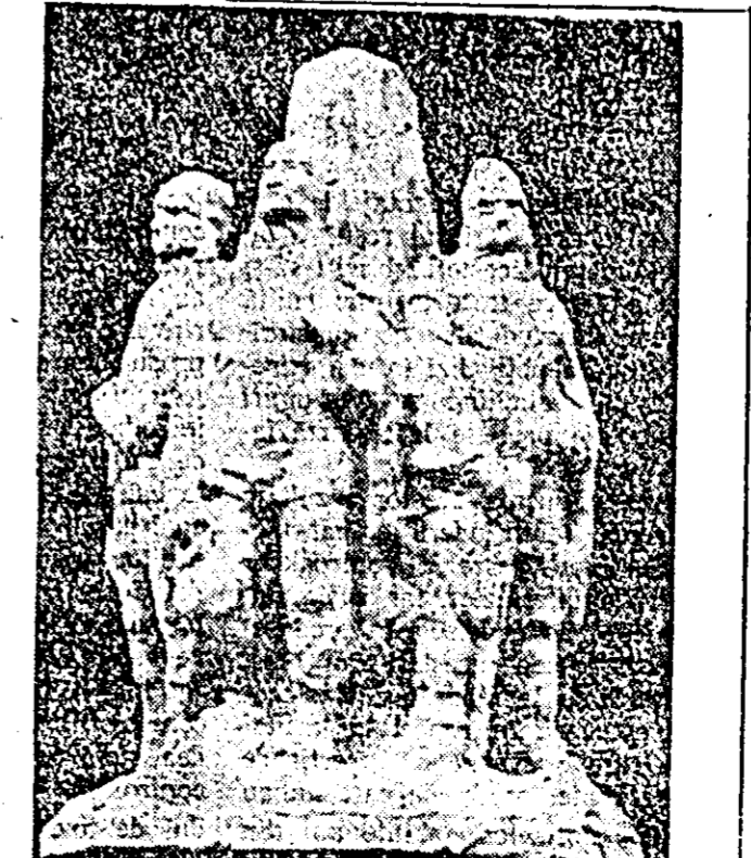
O lucrare a sculptorului Valeriu Brudașcu: Proiect de monument reprezentînd figurile lui Horia, Cloșca și Crișan.

Alt eveniment important pentru artiștii plastici din țara noastră și în special pentru cel tîneri va fi expoziția tînerilor artiști, din noiembrie a. c. ce se va deschide la București. Tematica acestei expoziții fiind dată, tînerii pictori și sculptori sînt puși în fața unor greie încercări. Lu-