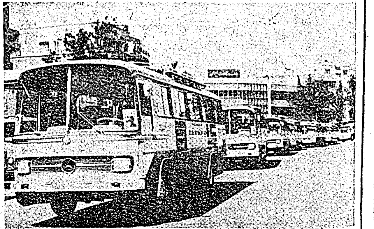
O colaborare rodnică, bazată pe egalitate în drepturi și avantaj reciproc, se stabilește tot mai mult între România și Iran. În cadrul ei, fabrica națională de automobile din Teheran, livrează 40 de mini-autobuze României.

POSTUL DE RADIO KINSHASA A ANUNȚAT CA GENERALUL MOBUTU, președintele Republicii Democrate Congo, a semnat un decret în virtutea căruia vor fi amnistiați toți deținuții politici. Postul de radio nu a precizat numărul și familiile persoanelor care vor beneficia de această amnistiere, subliniînd doar că hotărîrea respectivă are drept scop consolidarea unității naționale.