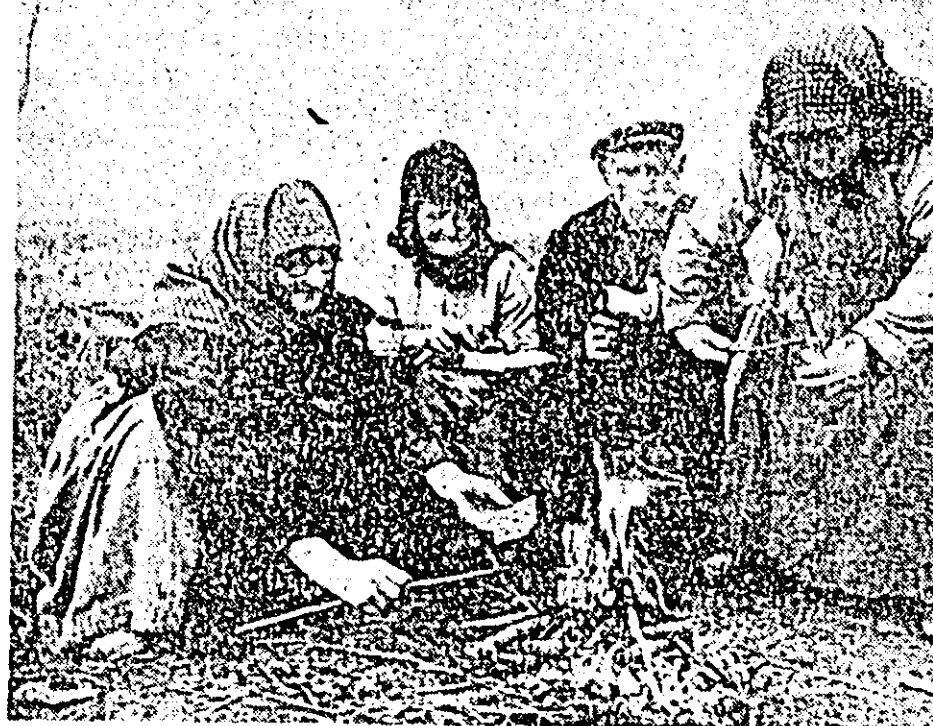
La grădina, în pauza de prînz.

Izvorul a fost captat în 1920, apă fiind dirijată într-o cîșmea. În prezent se desfășoară amenajarea parcului național Vîtoșea în scopul propunerii izvorului se vor construi două terase în piatră, cabane turistice etc.