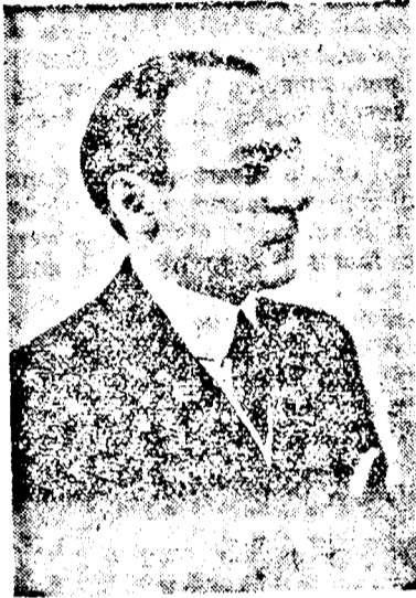
ARMAND CALINESCU belügyminiszter

Tanyákat községekké emelni, két vagy több községet egybeolvasztani, egyik községtől egy másikhoz csatlakozni: a községi tanács határozata