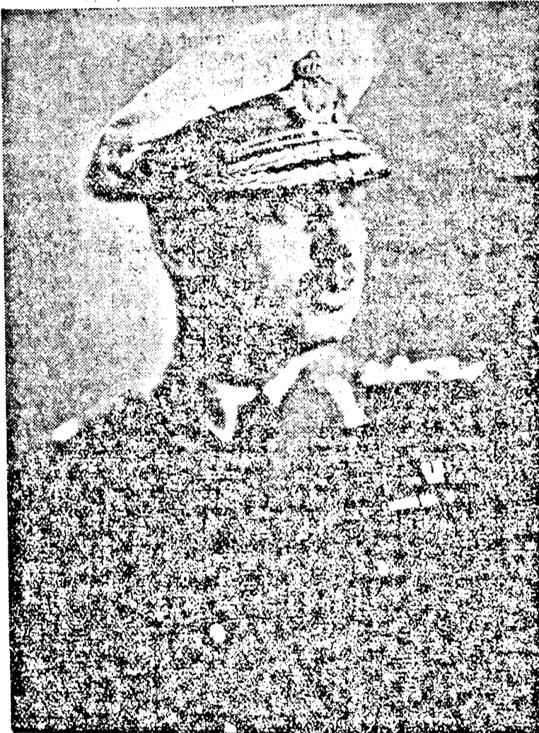
OFELSÉGE II. CAROL, a modern Románia megteremtője

Mint ismeretes, a szombati események középpontjában az új közigazgatási törvény királyi szentesítésének és a tartományi királyi helytartók