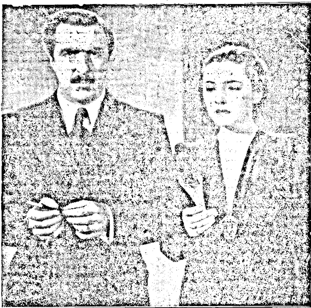
FERDINAND MARIAN, celebrul actor german care a realizat monumentalul film: „Evreul Süß” și Dorothea Wieck, interpreți noului film al casei Tobis: „CINE A UCIS” și care va rula în curând la mul din cinematografele comunale.

Intr'adevăr firea lui prematură și ușurința caracteristică din muzica lui nu sunt semne tipice nordice. Și totuși arta pe care a creat-o el este pur și simplu germană. Operele lui Mozart sunt pline de personalitatea lui și de peisajul în care a trăit el vieța lui prea scurtă.