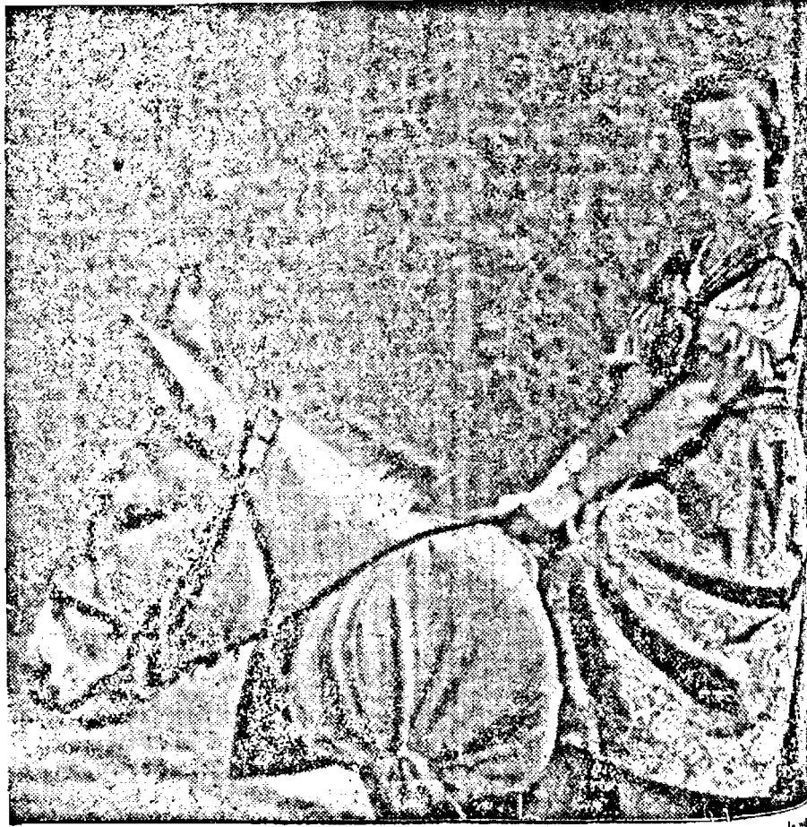
Frumoasa artistă germană HANSI KNOTECK, într'unul din rolurile sale

sa lui Jannings este la fel de armonizează de minime.