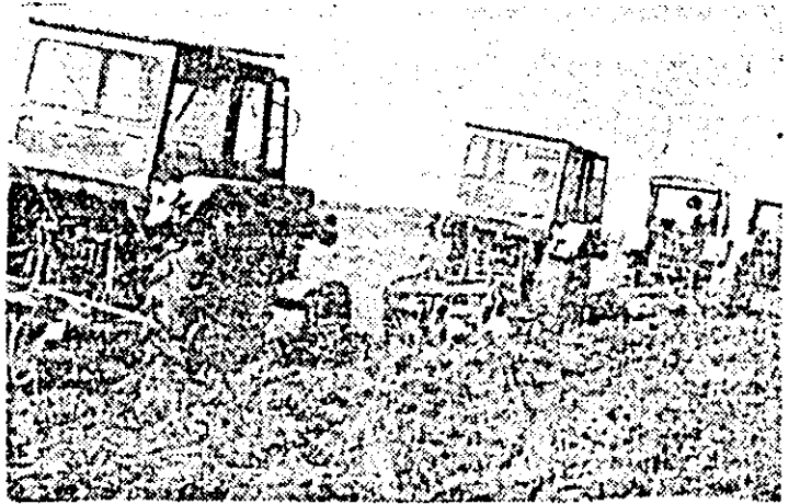
Folosind din plin fiecare oră bună de lucru, mecanizatorii de la S.M.A. Felnac desfășoară o activitate intensă la efectuarea arăturilor pentru însămînțările de toamnă.

O atenție deosebită se acordă executării arăturilor pentru însămînțările de toamnă. Printr-o amplă mobilizare de forțe, mecanizatorii au reușit în cursul zilei de duminică să întoarcă brazde noi pe o suprafață de 14813 hectare, după cum aflăm de la Direcția agricolă a județului. În total, arăturile sînt executate pe aproape 76 mil hectare, ceea ce reprezintă 51 la sută din suprafața destinată însămînțărilor de toamnă. Această lucrare este mai avansată în unitățile din zona de câmpie, în consiliile agroindustriale Șiria, Vladimirescu, Fintinele, Pecica, Nădlac și Felnac și rămase în urmă în zona de deal, în special în C.U.A.S.C. Săvîrșin, Sebiș și Tîrnova, unde se cere o mare mobilizare a tuturor forțelor în vederea urgentării acesteia.