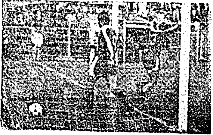
A înscris Galca și UTA a preluat conducerea.

tatea necesară, permițînd oaspeților să aplice în teren o lecție bine învățată: apărarea aglomerată, cu ieșiri rapide din jumătatea proprie, iar în fața — ce-o ieși. Și a ieșit... o lovitură de teatru. În min.