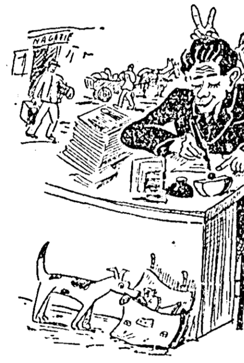
DELAPIDATORUL: — Să nu-l conlurbăm... lăsați-l să scrie... Psst!... Acest gură-cască e omul nostru.

— Să nu-l conlurbăm... lăsați-l să scrie... Psst!... Acest gură-cască e omul nostru.