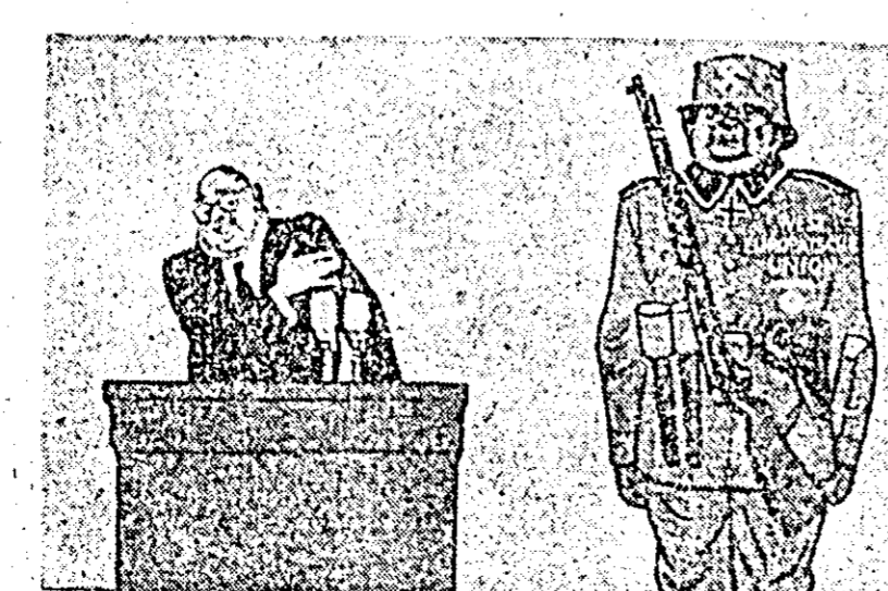
...Pe de altă parte el trebuie să corespundă intenției.