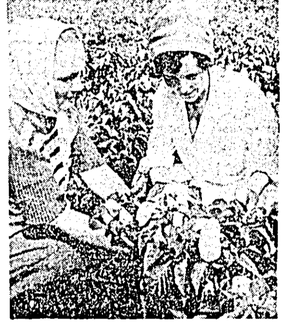
În loturile semincere ale Stațiunii de cercetări legumicole Aradul Nou, ardeii promise rod bogat.

Ca recolta de cereale din anul viitor să fie la fel de bună, ba chiar mai bogată ca-n acest an, mecanizatorii, muncitorii și specialiștii din unitățile Truștului I.A.S. pun la baza activității lor experiența cîștigată. În arăturile destinate însămînțării s-au în-