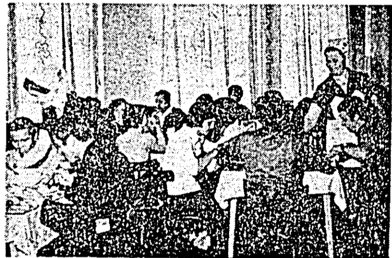
Cantina-restaurant „Tea” sectorului II al întreprinderii textile — se bucură de aprecieri unanime, atât pentru calitatea mâncărilor cât și pentru servirea ireproșabilă a abonaților.