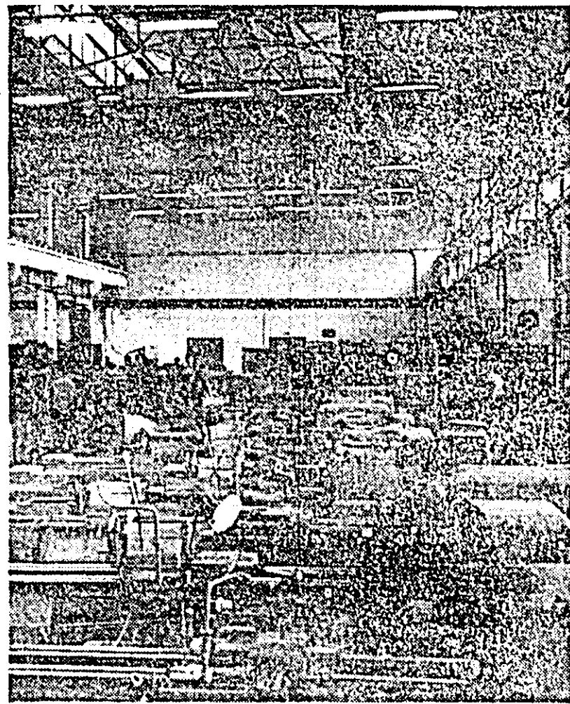
În această hală modernă strungurile în fază de finisare completă sînt supuse ultimului control tehnic. IN CLISEU: o secvență din secția montaj.