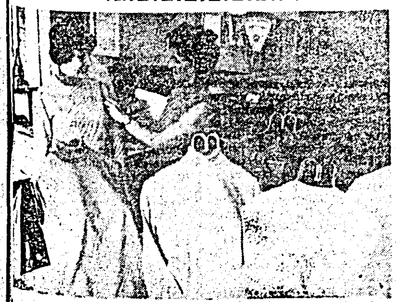
La fabrica „Tricol roșu” au fost vizate și omologate peste 20 de modele noi, remarcîndu-se în mod deosebit bluzele pentru femei, executate din bumbac merceizat.

Comitetele de direcție, colectivele întreprinderilor au datoria să ia măsuri hotărîte pentru a așeza producția pe bazele unei organizații judecătorești, științifice. În măsura să asigure îndeplinirea ritmică a tuturor indicatorilor de plan, mîrînd eficiența economică a întreprinderii prin reducerea cheltuielilor materiale de producție.