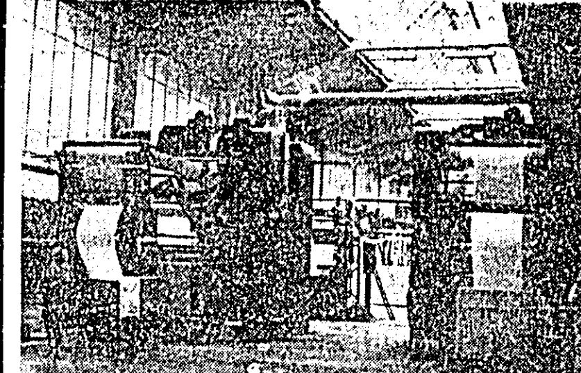
Zilnic la Uzinele textile „30 Decembrie” se fabrică 140.000 m țesături. Aspect din secția albitoriei.