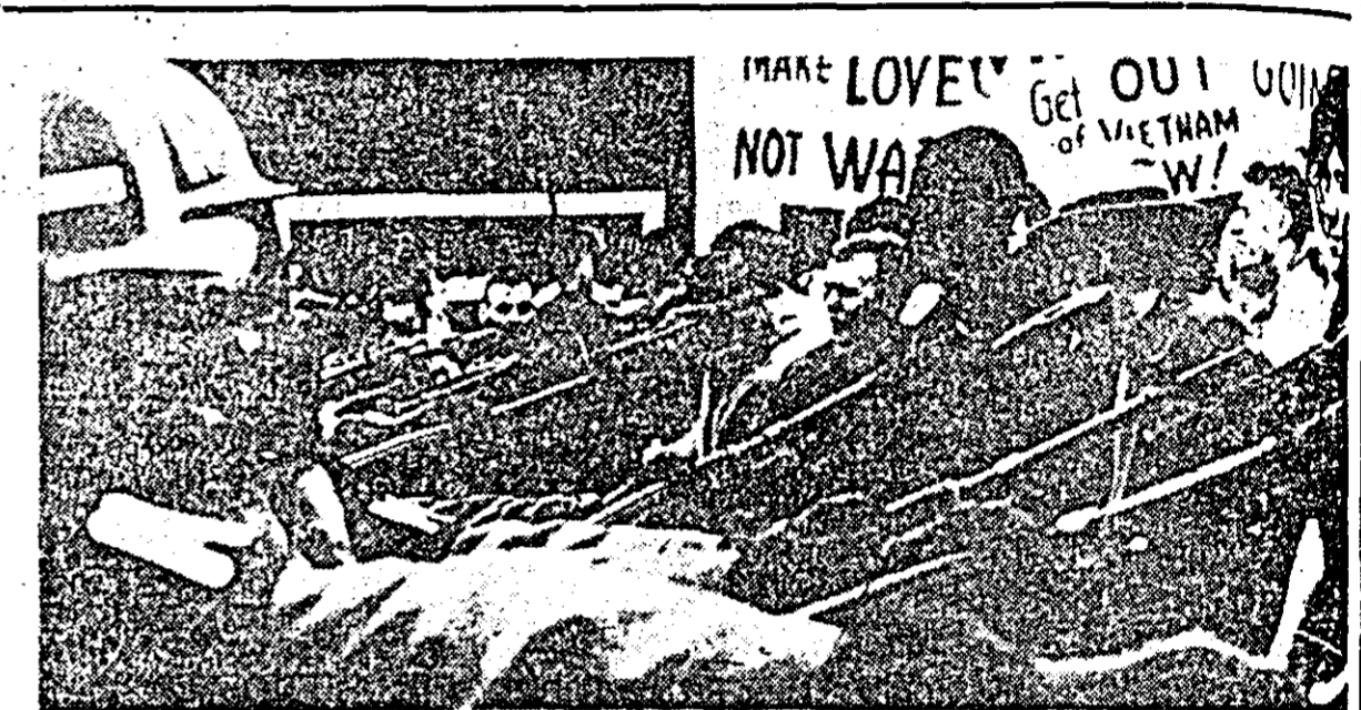
S. U. A. — Puternicele demonstrații împotriva războiului din Vietnam continuă. Ele sint prite cu brutalitate de forțe polițienești, după cum se vede în fotografia alăturată.

SAIGON 15 (Agerpres). — După cum relatează agenția France Presse, forțele patriotice sud-vietnameze care acționează în provincia Tra Vinh au atacat recent trei depozite de unități saigoneze din sectorul Long Binh, au intrat într-un depozit ce conținea peste 100.000 de litri de benzină, petrol și două camioane destinate transportului carburanților. Depozitul cel mai mare din întreaga provincie, a fost distrus complet, se estimează că forțele patriotice au bombardat în același timp o serie de baze americane militare situate în localitatea Tra Vinh și în prejurimile sale. De asemenea, a riuul Duong Keo, două ambarcațiuni militare saigoneze au fost grav avariate.