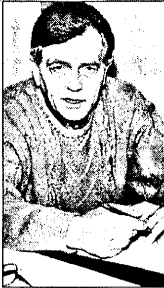
aprecierea PNTCD-ului, care își va nominaliza, probabil, și alt om pentru această funcție. După alegeri, locurile de prefecti au fost împărțite între partidele din coaliția guvernamentală...