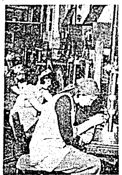
Aspect de muncă din secția prese a întreprinderii de bunuri metalice.