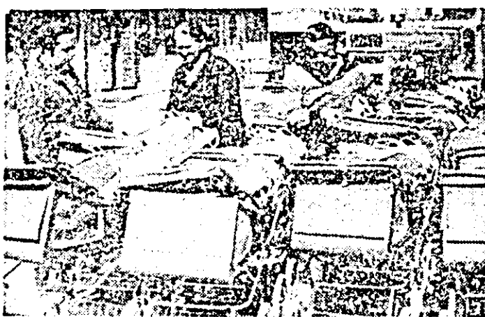
Întreprinderea de bunuri metalice. Un nou lot de căruioare pentru copii e pregătît pentru livrare.