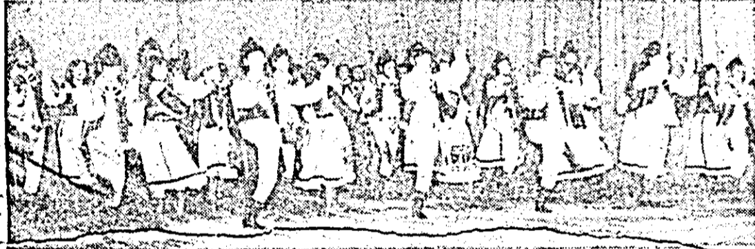
Ansamblul de dansuri populare al sindicatului întreprinderii de vagoane.