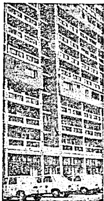
Noi apartamente date în folosință în zona Pasaj Micăla-ca.

Utilizarea rațională a capacităților de producție, în sensul folosirii mașinilor și utilajelor cu indici cît mai înalți, constituie una dintre cerințele principale ale noului mecanism economic. Cum au fost utilizate anul trecut în județul nostru aceste mijloace? Indicii înregistrați ne spun că pe ansamblu au fost folosite în 86,4 la sută din timpul disponibil și anume: cele din secțiile de bază și sculării cu un indice mai înalt — 87,3 la sută, iar cele din secțiile indirect productive cu unul mai scăzut — 82,3 la sută. Trebuie să subliniem totodată că un grad sporit de utilizare a fost înregistrat la mașinile complexe, de înaltă tehnicitate, cum sînt strungurile automate și semiautomate — 98,2 la sută, mașinile de rectificat roți dințate — 96,1 la sută, mașinile de frezat verticale și portale — 91,0 la sută etc. asigurându-se astfel o exploatare eficientă a acestor mijloace. Indicii menționați arată că